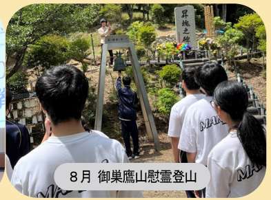
8月 御巢鷹山慰霊登山