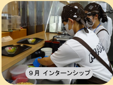
9月 インターンシップ