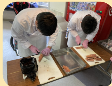
商品開発(ニジマスカレーバーガー)