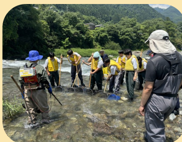
陸封アユ生態調査@柏木堰堤

水産全般を学ぶだけでなく、地域活性化をテーマに地元のお店や企業とコラボして商品開発を行っています！メディアにも数多く取り上げられている、群馬県唯一の水産が学べる学校です！