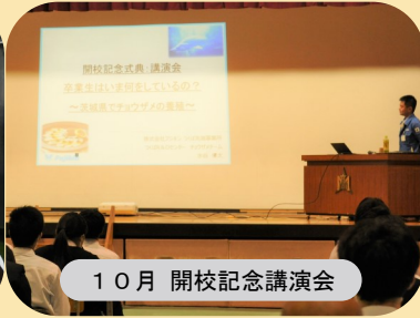
10月 開校記念講演会