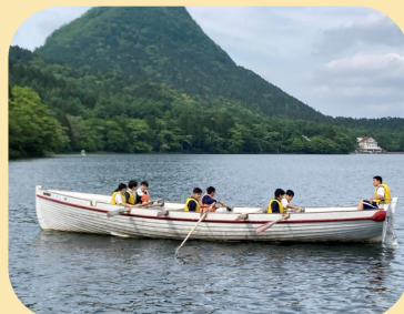
カッター実習in榛名湖