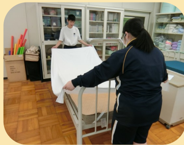
ベッドメイキング