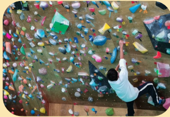
クライミング同好会