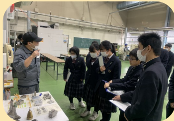
企業・上級学校見学会